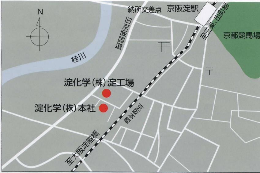
淀化学株式会社本社および淀工場案内図